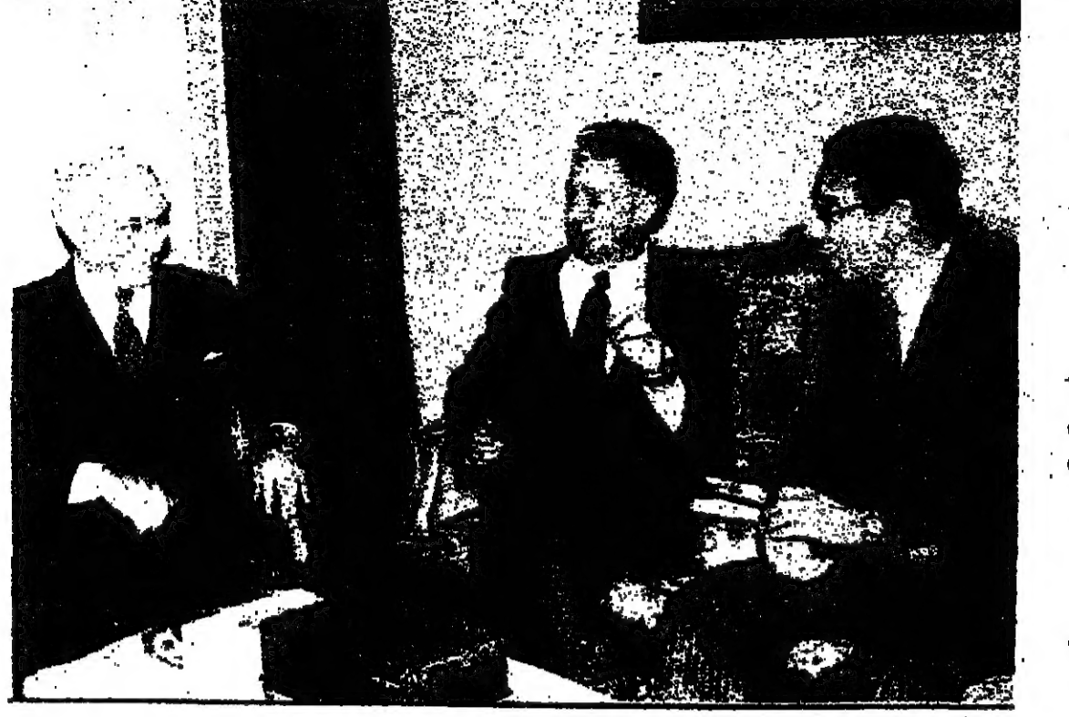
سول لنيوفيس في حديث مع الدكتور بطرس غالي، وزير الدولة المصرية للشؤون الخارجية والدكتور مصطفى خليل، نائب رئيس الحزب الوطني الديمقراطي الحاكم في مصر.

مع اقتراب موعد تسلم الإدارة الأمريكية الجديدة مهامها، وبعد حوالي شهر من الزمان، يمكن القول بأن التحضيرات لتحديد الخطوط الرئيسية لمسيرة السلام في الشرق الأوسط قد بدأت. لقد انتشرت التوقلات أثناء الانتخابات الأمريكية، بأن المسيرة قد جمدت، أو وضعت في تلة، وأن الحرارة ان تذب في أوصالها. إلا بعد الانتخابات الإسرائيلية بعدة شهور، ذلك لأن الرئيس الأمريكي الجديد، سيحتاج إلى شهرين لإجراء أكتواره، ولأن الوزارة الإسرائيلية الجديدة، ستحتاج إلى الأخرى إلى شهور لتحديد مواقفها، الأمر الذي يعني التوقف لأكثر من عام. بيد أن زيارة سول لليونيفيس للمنطقة، والرسائل التثوية التي بعثها إلى كبار المسئولين في مسيرة السلام، والذين اختلفوا في المبادئ، وساروا بخطواتها الرئيسية الأولى، وتؤكد أن احتمالات توقف هذه المسيرة أو تجميدها، قد أصبحت غير واردة.